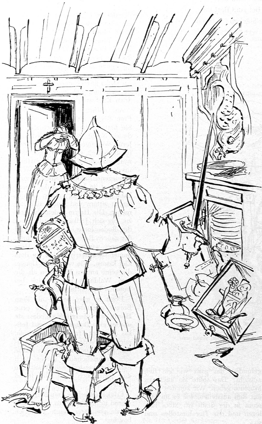
Illustration von Walter Schwyn aus SJW-Heft Nr. 708 «Schreckenstage im Schwarzwald»