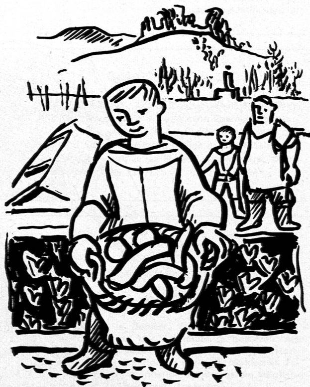
Illustration von Walter Kuhn aus SJW-Heft «Die Gärtnerei am Falterhügel»

Zwei Knaben und ein Mädchen wohnen in der Gärtnerei am Falterhügel in einer schönen, behüteten Welt. Arbeit in der Gärtnerei, Hüttenbau, die Errichtung eines kleinen Museums durch die Kinder wechseln miteinander ab. In schöner, un-