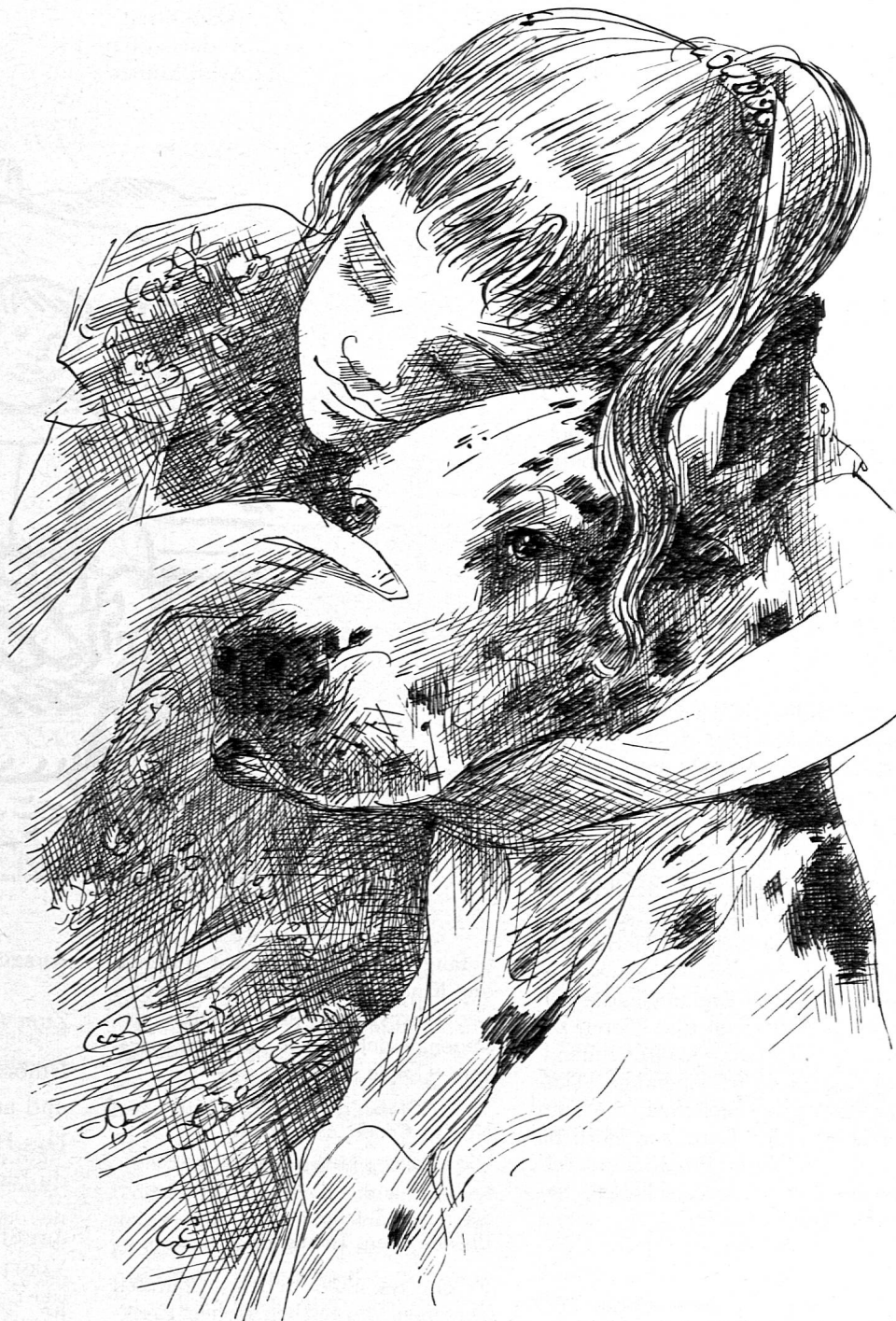
Illustration von Josef Keller aus SJW-Heft Nr. 709 «Tiergeschichten»