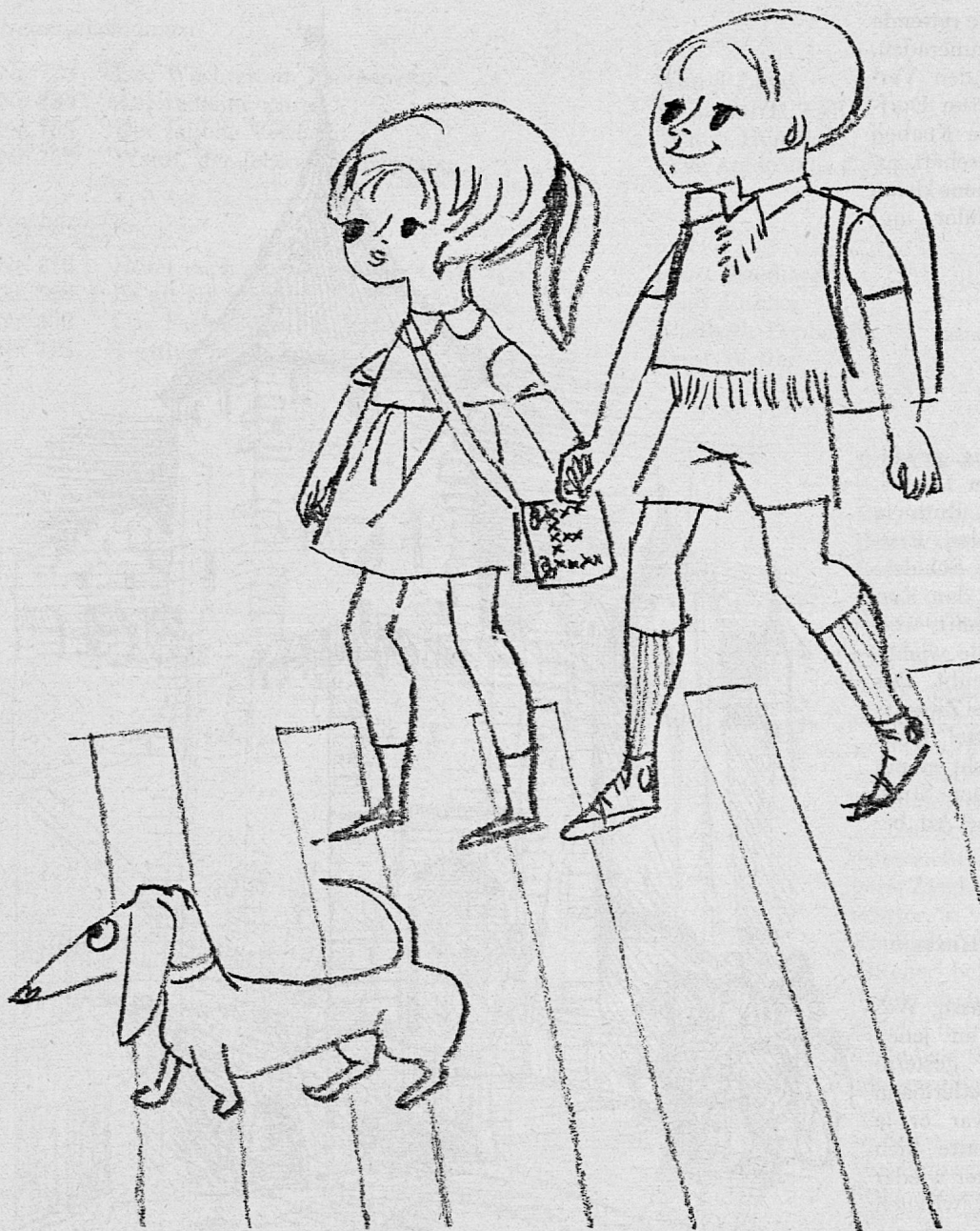
Illustration von Felix Gyssler aus SJW-Heft Nr. 736 «Waldi, der lebende Wegweiser»

Bild 2 Die dreijährige Ruth hält Waldi an der Leine. Esther mit ihrem Umhängetäschchen will in den Kindergarten. Max geht in die erste Klasse.