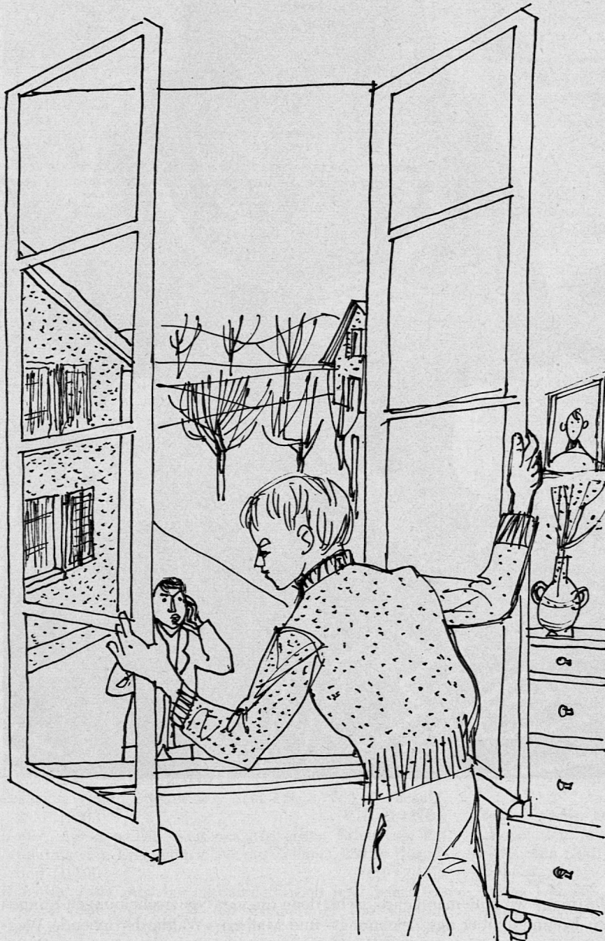
Illustration von Werner Christen aus SJW-Heft Nr. 735 «Der falsche Verdacht»

BÜCHER SIND IMMER NOCH DIE WOHLFEILSTEN LEHR- UND FREUDENMEISTER UND DER WAHRE BEISTAND HIENIEDEN FÜR MILLIONEN BESSERER MENSCHEN.