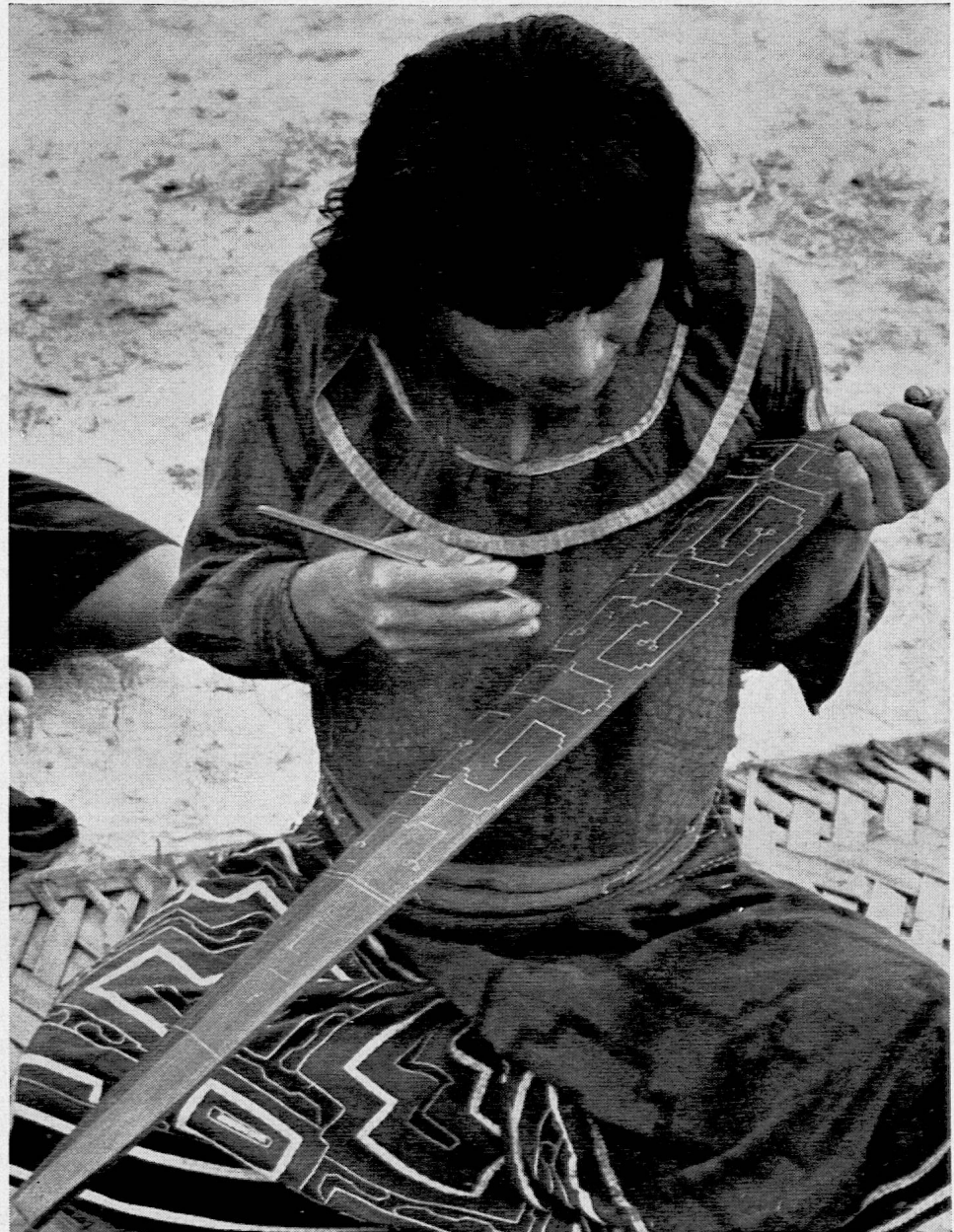
Photographie aus SJW-Heft Nr. 734 «Auf Indianerspur» von Luise Linder und Heidi Egli