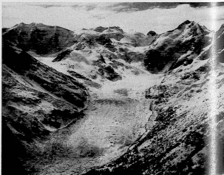
Piz Bernina, Piz Palü, Piz Morteratsch