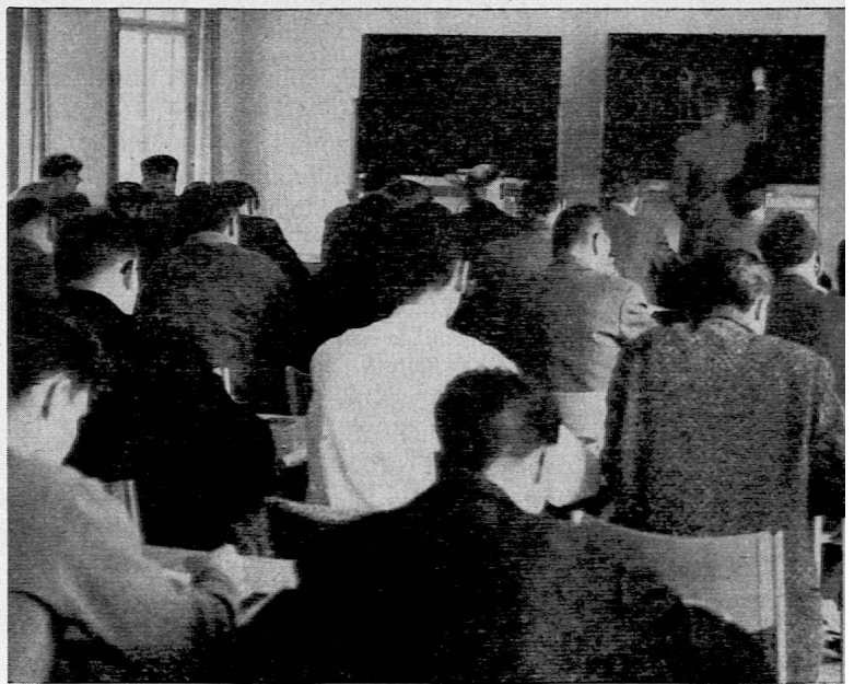
Weiterbildungskurs für Real- und Oberschullehrer

«Probleme des Geschichtsunterrichtes auf der Oberstufe», G. Huonker, Sekundarlehrer, Zürich.