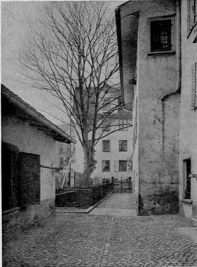
Das Haus «Zum Brunnen» der Familie Escher-Gossweiler, in dem Ebel jederzeit ein Zimmer zur Verfügung stand. — Blick von «In Gassen» nach dem Ahornbaum, der am 11. April 1911 gefällt wurde, weil er zu nahe der Neubaute der Schweizerischen Kreditanstalt (Griederhaus) stand. Aufnahme Hofer & Co., März 1911

den Dänen Friedrich Münter, dass er Stoff zu einem «Versuch über die Menschen und ihre Führung» sammle und darum eifrig lese 3 . In der Tat zeigen die «Bemerkungen zu gelesenen Büchern» (1788, 1792, 1793/94), dass Pestalozzi «eine neue Carriere» eingeschlagen hat, wie er an Münter schreibt. Hier interessiert besonders Pestalozzis Stellungnahme zu dem 1791 in Paris erschienenen Buche seines Landsmannes Jakob Heinrich Meister: «Des premiers principes du système social, appliqués à la révolution présente». Ebel stand mit Freunden in Paris in Verbindung, die ihn schon 1790 dahin hatten ziehen wollen. Was Pestalozzi von der Revolution dachte, musste ihn in hohem Masse interessieren. Man steht unter dem Eindruck, dass schon in Zürich Ebels späterer Aufenthalt in Paris vorbereitet wurde.