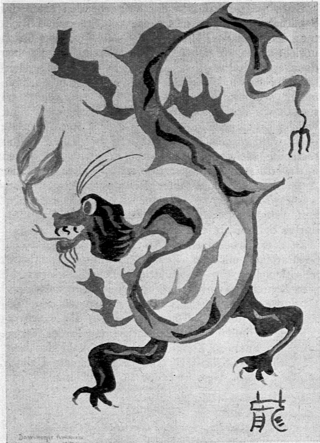
Drache, Format 40/29 cm

Ausgeschnittener Drache: Unser Drache kann beidseitig bemalt werden, indem man die Rückseite gegen eine Fensterscheibe hält und die Bemalung zuerst durchzeichnet. Dann schneiden wir den Drachen aus. An einem Faden über einer Wärmequelle aufgehängt (Heizkörper, Kerze o. ä.), bewegt und windet sich das Ungeheuer.