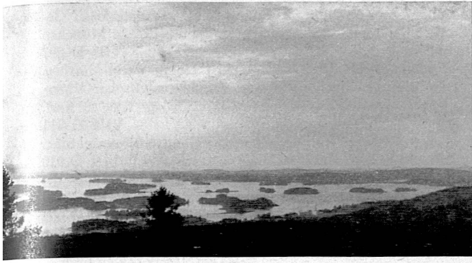
Kuopio, Blick vom Puijo