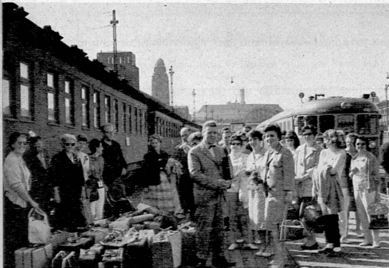
Abfahrt in Helsinki