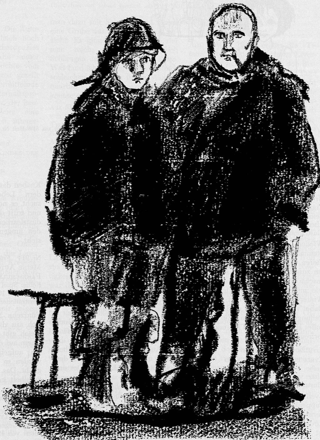
Illustration von Godi Hofmann aus SJW-Heft Nr. 913 «Lars, der Lofotfischer»

wird mit der Herausgabe von 7 Neuerscheinungen und 1 Nachdruck abgeschlossen. Die 48seitigen Hefte «Unsere Gotthardbahn» und «Wenn sich doch alle Kinder der Welt die Hand reichten...» (Die Geschichte des Roten Kreuzes) sowie das Heft «Gestohlen, verbrannt, verunfallt» (Entstehung und Aufgabe der Versicherungen) geben nicht nur den jugendlichen Lesern, sondern auch den Eltern aufschlussreiche Hinweise. Die kleinen Mädchen werden sich besonders über das Heft «Eveli und das Wickelkind» freuen; die grösseren Kinder aber werden mit Spannung das Heft «Lars, der Lofotfischer» lesen. Ganz besonders sei auch noch auf das Modellbogenheft «Meine Autofabrik und Fahrschule» sowie auf das neue Heft von Carl Stemmler «Tiere verschlafen den Winter» hingewiesen.