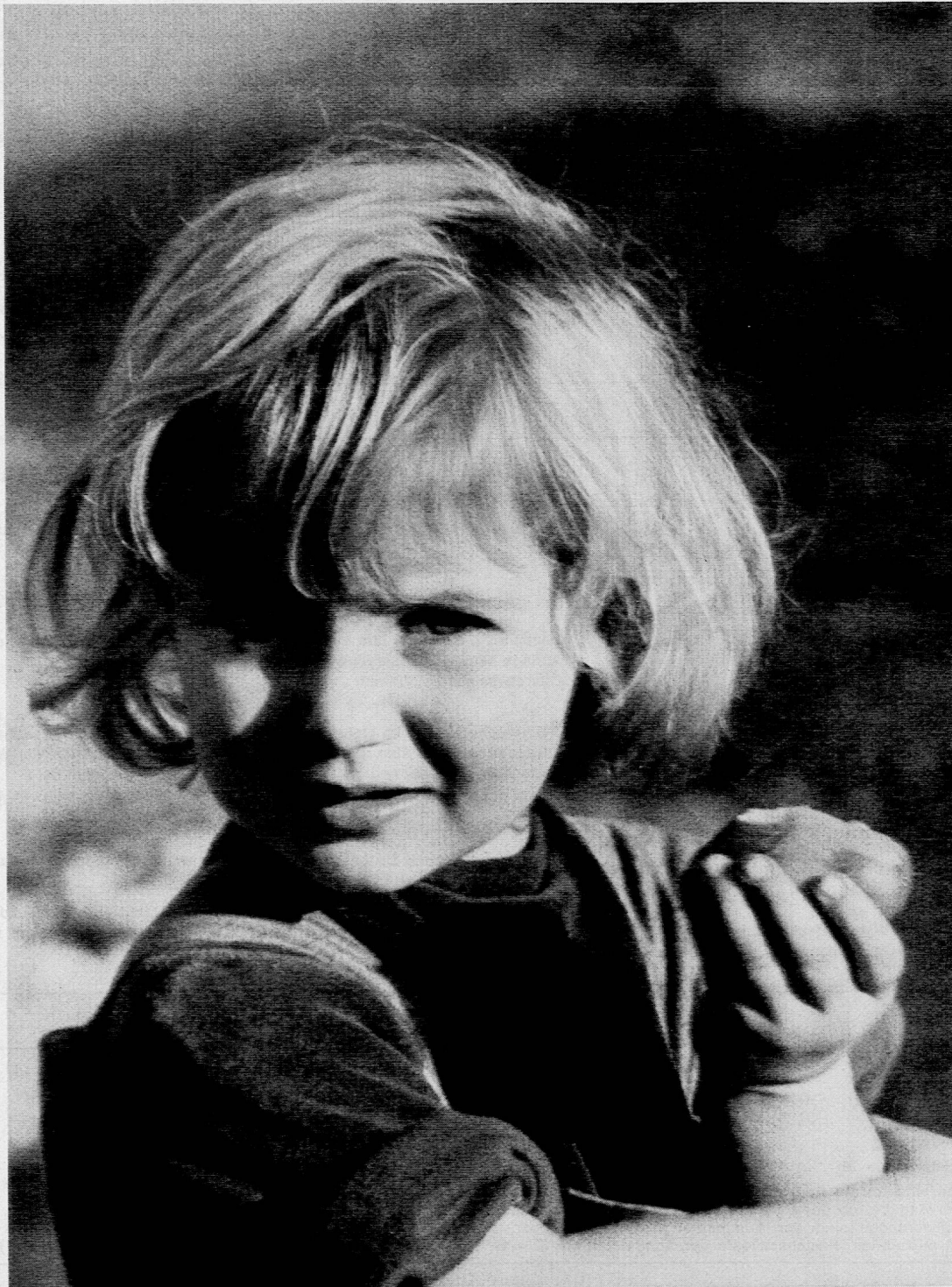
Mädchen mit Mostbirne

Sonderheft: Gesundheitserziehung und Schule