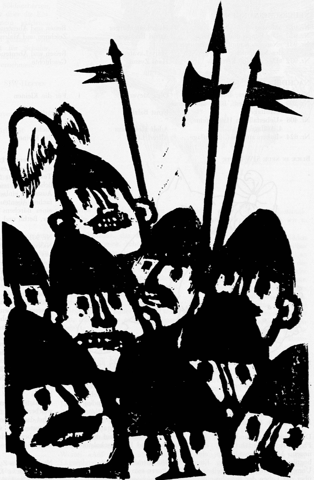
Illustration von Röbi Wyss aus SJW-Heft Nr. 932 «Das goldene Kettlein».