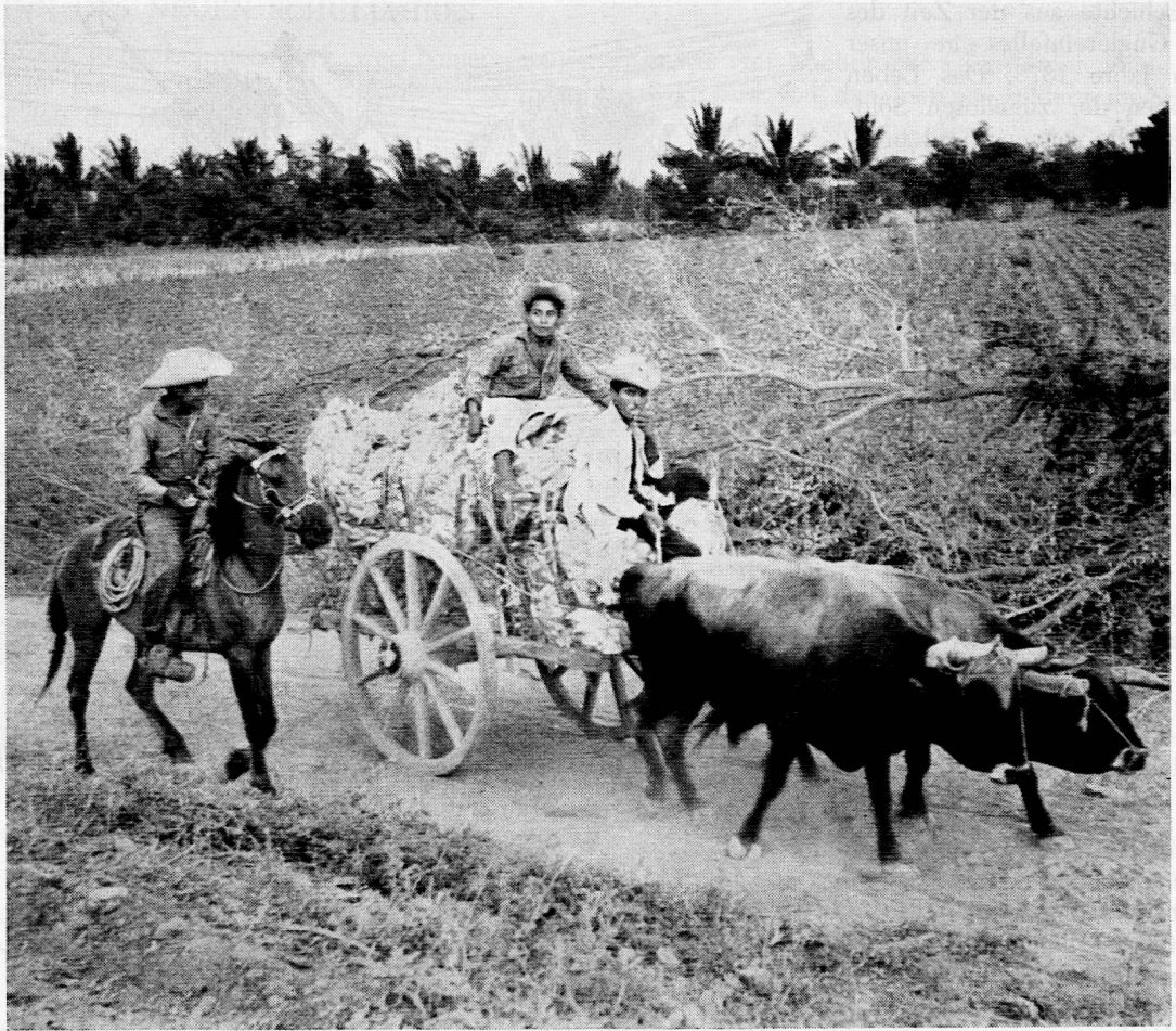
Photographie von Hans Leuenberger aus SJW-Heft Nr. 929 «Mexiko»

Seit zwei Jahren lebten sie nur unter Männern. Rasch weiter nach Süden, der Heimat entgegen! Jetzt wurde ihnen bei der Bezwingung des aufgetürmten Eises «in der brennenden Sonne unbehaglich infolge der Hitze», und doch zeigte das Thermometer immer noch minus 26 Grad. Am 17. April schrieb Nansen in sein Tagebuch: «Das Dasein wird immer schöner, die Kälte ist vorüber, und wir dringen immer weiter dem Lande entgegen. Jetzt ist es keine Prüfung mehr, morgens aufzustehen, einen tüchtigen Marsch vor sich zu haben, zu kochen, nachher behaglich warm im Sack zu liegen und von einer glücklichen Zukunft zu träumen.»