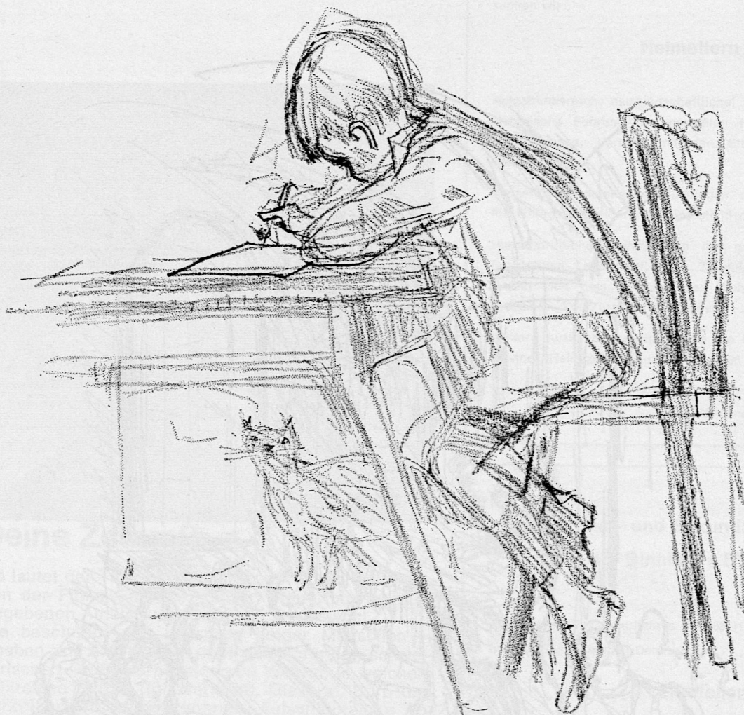
Illustration von Sita Jucker aus SJW-Heft Nr. 34 «Edi»

gibt das Schweizerische Jugendschriftenwerk die nachfolgend aufgeführten Neuerscheinungen und Nachdrucke heraus. Ausnahmsweise sind nur zwei neue SJW-Hefte erschienen; dafür sind, anstatt wie bisher acht, gesamthaft zehn vergriffene, immer wieder verlangte Titel in neuen Auflagen herausgegeben worden. Die kleinsten Leser finden unter den Nachdrucken einige Lieblingshefte, wie Nr. 7 «Nur der Ruedi», Nr. 34 «Edi» und Nr. 542 «Samichlaus und Christkind»; sie gehören zu den SJW-Bestsellern, die in 9., 8. und 5. Auflage erscheinen.