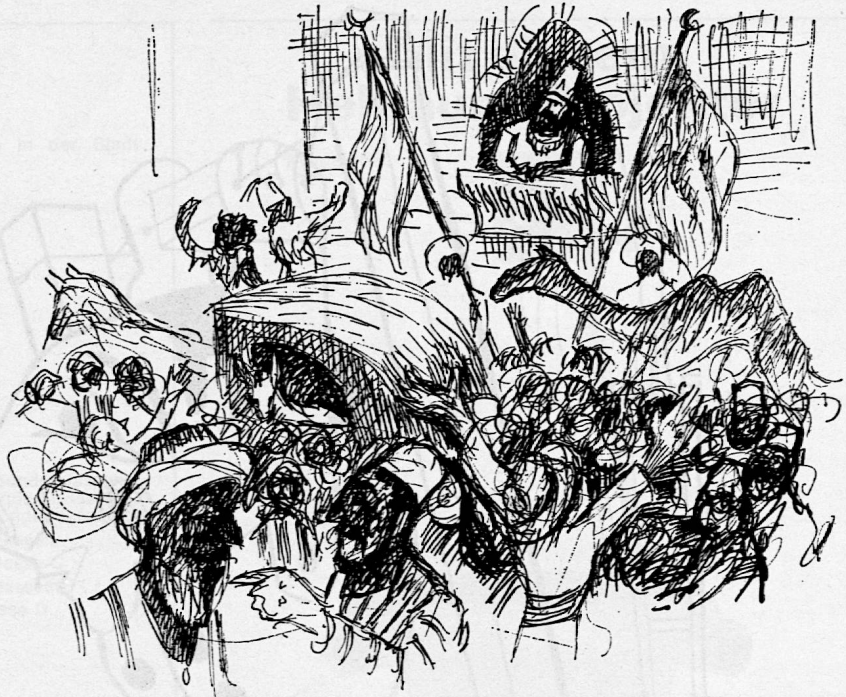
Illustration von Reinhold Kündig aus SJW-Heft Nr. 690 «Das Eselein Bim»