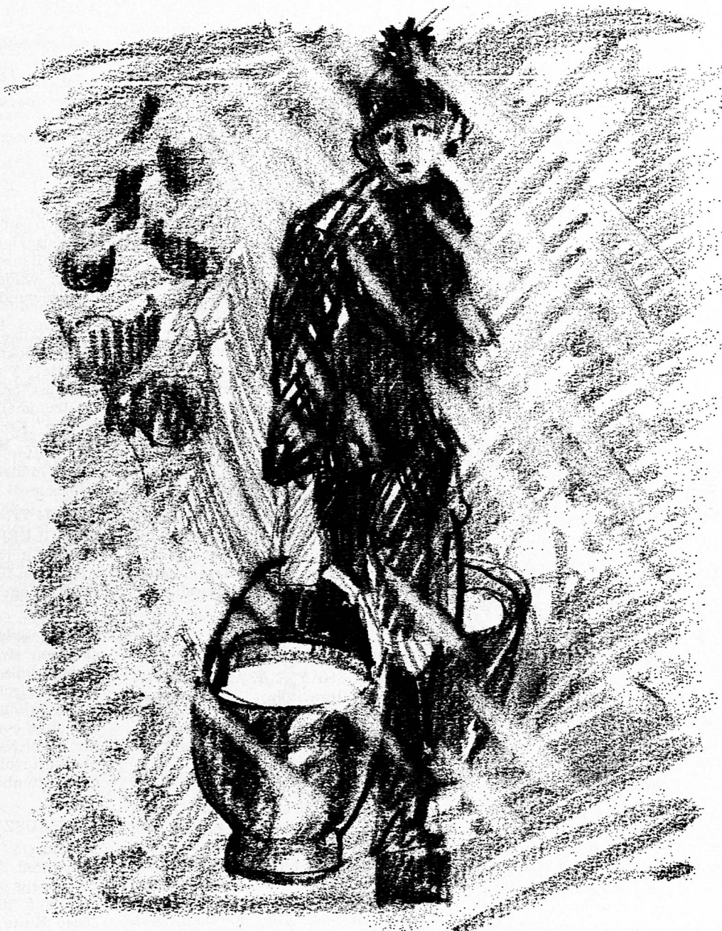
Illustration von Rudolph Kuenzi aus SJW-Heft Nr. 1077 «Halt in der Schlucht»