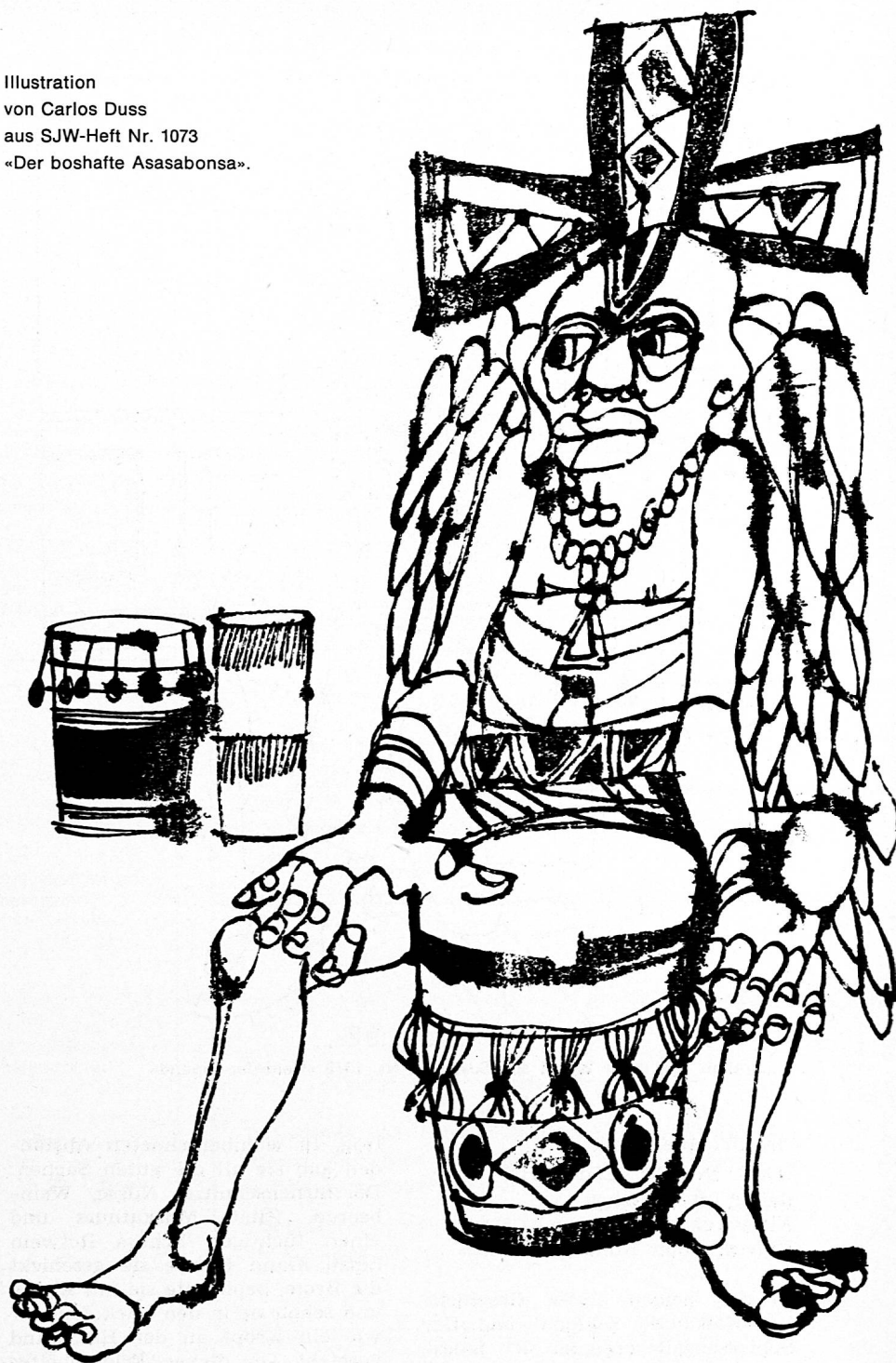
Illustration von Carlos Duss aus SJW-Heft Nr. 1073 «Der boshafte Asasabonsa».

Ein Mundarttheaterstücklein (Zürcher Mundart) um das Thema Brot, das von einer ganzen Primarklasse aufgeführt werden kann. In lebendigen, einfallsreichen Szenen wird der ganze Entwicklungskreis von der Aussaat der Körner bis zum duftenden Brot im Bäckerladen dargestellt. Sprechchöre wechseln mit Gesprächszenen ab. Das Ganze ist ein guter Wurf für das Schultheater.