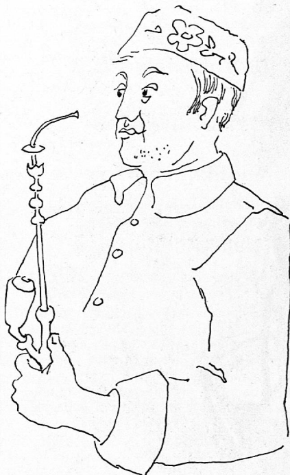
Illustration von Ruth Item aus SJW-Heft Nr. 1074 «Der Glühbirnenbaum»

Muschg Elsa Für die Kleinen Daudet Alphons Malhefte Hans Bracher Geschichte Max Bolliger Für die Kleinen Elisabeth Lenhardt Für die Kleinen Hans Bracher Geschichte Adolf Haller Literarisches Olga Meyer Für die Kleinen