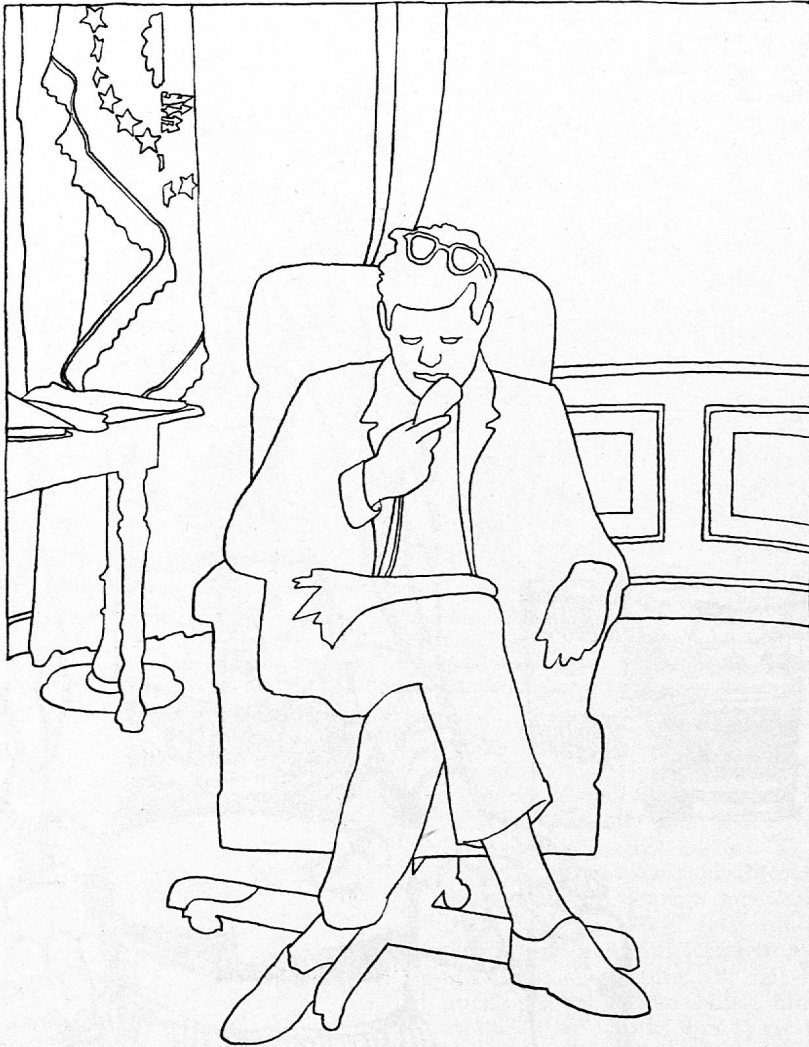
Illustration von Peter Wezel aus SJW-Heft Nr. 1079 «Held der Jugend»