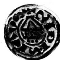
Moulage sans retouche