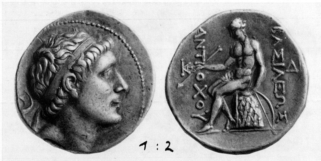
2803 Syria, Antiochia ad Orontem, Antiochos II., 256—246 v. Chr., Tetradrachmon, Dm. 28,5 mm, Gew. 17,125 g, Rs. → (!) Newell, Western Sel. Mints , Nr. 976; Brett, Cat. Gr. Coins , Boston, Nr. 2154 Taf. 99. Aus: Santamaria, Auktion 1961 , 139.

Von den 25 angekauften antiken Münzen seien erwähnt: