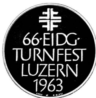
ENTWURF AUGUST BLÄSI LUZERN AUSFÜHRUNG HUGUENIN LE LOCLE

Zum Eidgenössischen Turnfest am 27. bis 30. Juni 1963 in Luzern wird ein Gedenktaler herausgegeben.