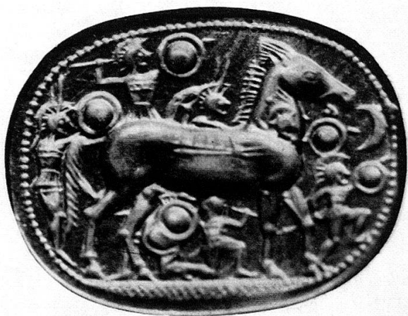
Abb.4 Skarabäus, New York, Vergr.