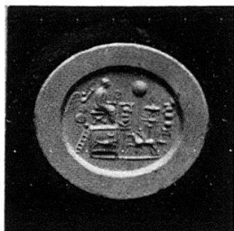
Abb.3 Wie Abb.1 (1:1)