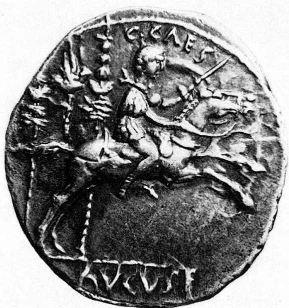
Abb.5 Denar, Paris, Cab. Méd., Vergr.