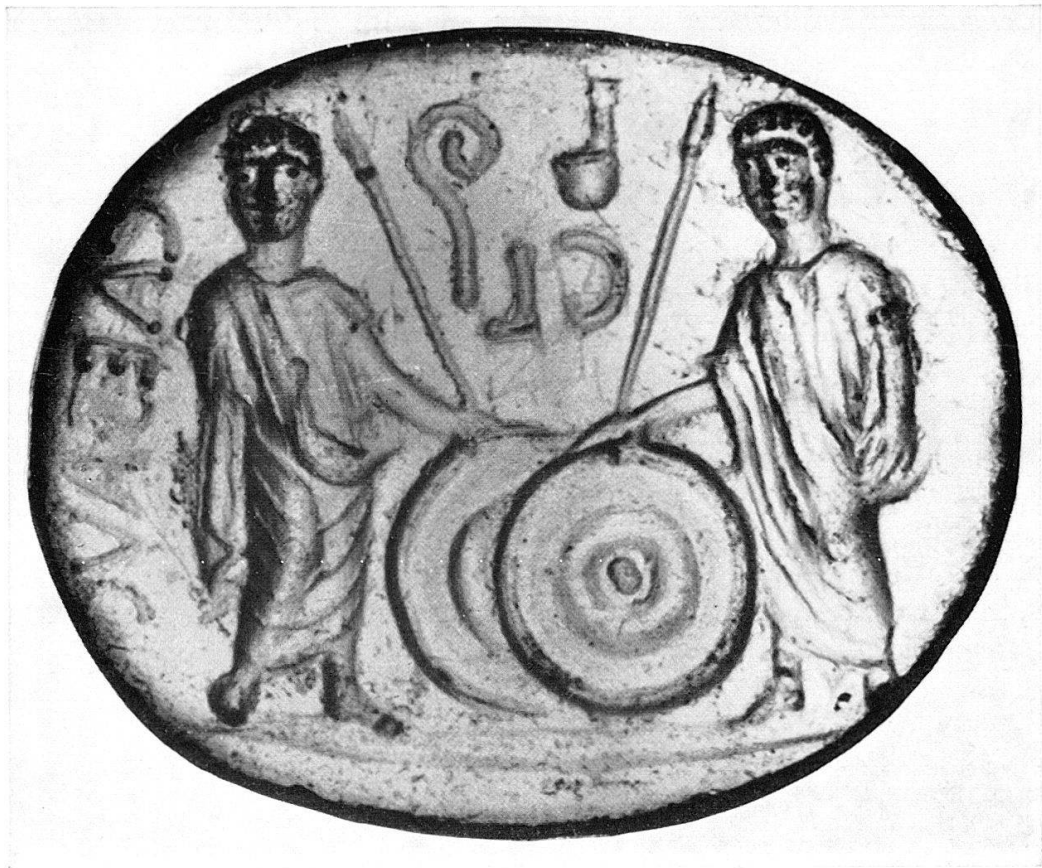
Abb. 6 Karneol, Florenz, Original, Vergr.