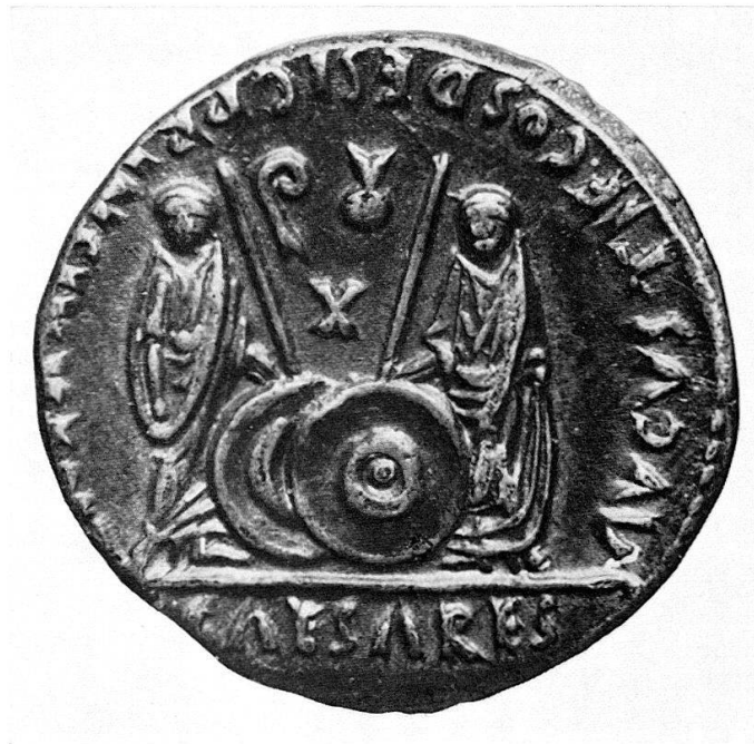
Abb. 7 Denar, Paris, Cab. Méd., Vergr.