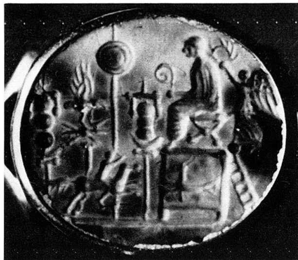
Abb.2 Sard, Florenz, Original, Vergr.