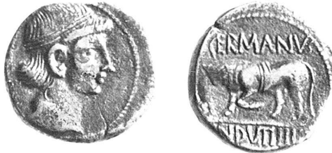
Musée historique de Berne