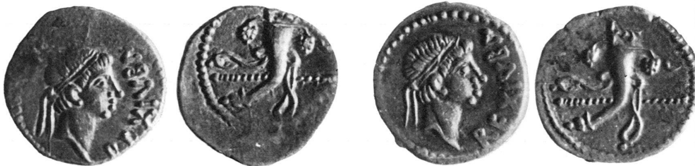
No. VII-A-44 AR 3,205 g 16,7 mm ↘

The coins from the Collection of the National Museum in Cracow and the Royal Collection of Coins and Medals Danish National Museum in Copenhagen 7 form the 13th variety of this type. On these reverses the sceptre is placed horizontally in the middle of the cornucopiae. In the upper right field there is a small crescent. The obverse is typical since it presents the legend REX IVBA.