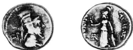
Fig. 2 Dramma di Ariarathes VI (con tiara) (Coll. personale).

quello della madre Nysa, con la scritta al R/ ΒΑΣΙΛΙΣΣΗΣ ΝΥΣΗΣ ΚΑΙ ΒΑΣΙΛΕΩΣ ΑΡΙΑΡΑΘΟΥ ΕΠΙΦΑΝΟΥΣ ΤΟΥ ΥΙΟΥ, ed una serie di dramme datate dal I o al XV o anno di regno, con la scritta al R/ ΒΑΣΙΛΕΩΣ ΑΡΙΑΡΑΘΟΥ ΕΠΙΦΑΝΟΥΣ (fig. 7-9).