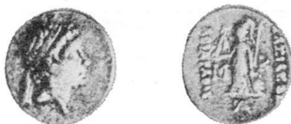
Fig. 6 Dramma di Ariarathes VI con diadema e con la semplice scritta ΒΑΣΙΛΕΩΣ ΑΡΙΑΡΑΘΟΥ (da Mørkholm, con l'attribuzione ad Ariarathes VIII).