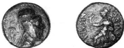
Fig. 4 Bronzo di Ariarathes VI (con tiara) (Coll. personale).