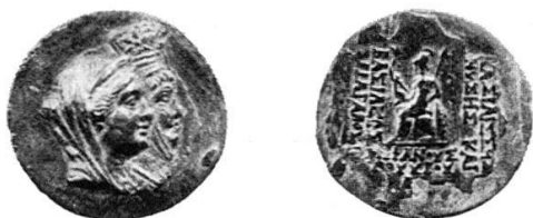
Fig. 1 Dramma di Ariarathes VI (con tiara) e Nysa (Parigi, Cabinet des Médailles).

Ad Ariarathes VI Epiphanes, Re di Cappadocia dal 130 al 116 a. C., si attribuiscono, senza ombra di dubbi in proposito, una dramma (unica) del Cabinet des Médailles (fig. 1) in cui il busto del Re giovanetto è raffigurato accanto a