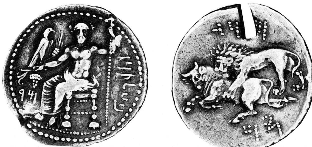
Fig. 9 Mazaeus (circa 361–333 a. C.). Statere (Coll. personale).