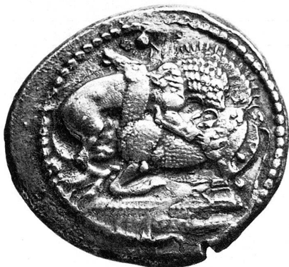
Fig. 4 Stagira (circa 520 a. C.). Statere. Fig. 5 Skione (circa 500 a. C.). Statere (Museo di Winterthur).