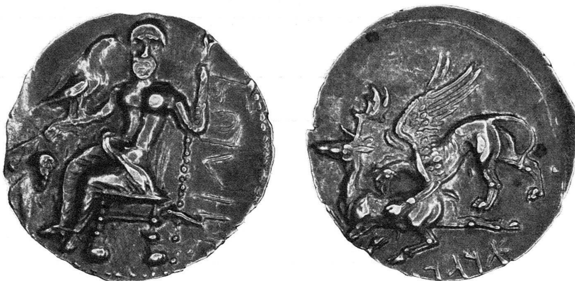
Fig. 10 Cappadocia. Ariarathes I (333–322 a. C.). Dramma (Coll. personale).