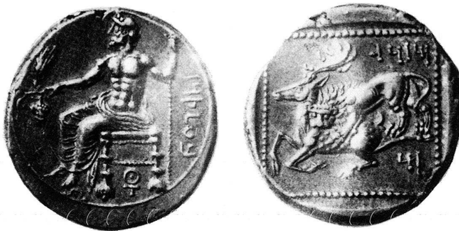
Fig. 8 Tarsus. Mazaeus (circa 361–333 a.C.). Statere (da Hirmer, Die griechische Münze).