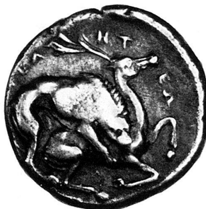
Fig. 6 Byblus (circa 360–340 a. C.). Tetradramma (Coll. privata). Fig. 7 Velia (circa 350 a. C.). Didramma (Coll. personale).