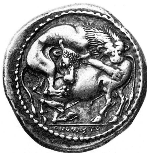
Fig. 2 Acanthus (circa 420 a. C.). Statere (Cab. des Médailles; da J. Desneux). Fig. 3 Acanthus (circa 380 a. C.). Statere (ex. Coll. Imhoof-Blumer; Museo di Winterthur).