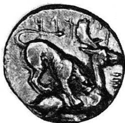
Fig. 1 Citium. Pumiathon (circa 361–312 a. C.). Emistatere d'oro (Coll. privata).

Il motivo del leone che assale la sua preda è notevolmente diffuso sia nelle antiche sculture medio-orientali, greche e romane, sia nelle pitture su vasi, sia nelle monete; J. Desneux si è abbastanza recentemente intrattenuto sull'argomento (RBN 1960).