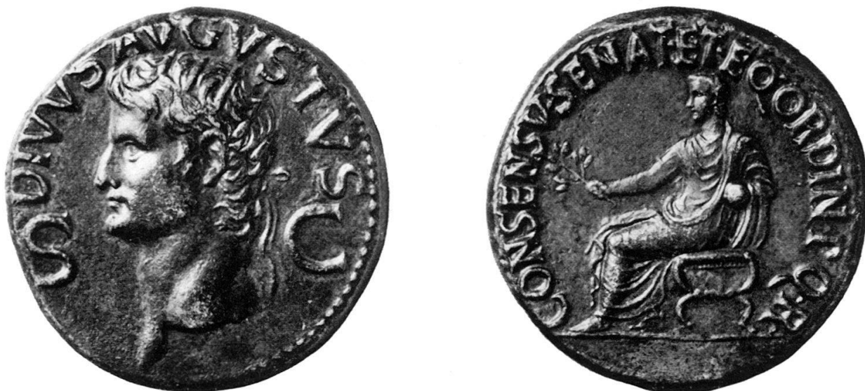
Abb. 6 (2 : 1)

Während man früher, fehlgeleitet durch die Identifizierung der sitzenden Gestalt mit Augustus als selbstverständlich annahm, daß sich die Legende CONSENSV SENAT ET EQ ORDIN P Q R auf den ersten Princeps 24 bezog, ist eine solche Interpretation jetzt nicht mehr plausibel. Die für die Regierungszeit Caligulas zurückgewonnene Prägung findet vielmehr ihre präzise Deutung in den literarisch überlieferten Begebenheiten zu Beginn seiner Herrschaft 25 . Nach dem Ableben des Tiberius am 16. März 37 n. Chr. wurde er in Misenum von den Gardetruppen zum Imperator ausgerufen und Ende März übernahm er in Rom offiziell die kaiserlichen Vollmachten. Dabei soll Caligula, wie Dio Cassius 59, 6 berichtet 26 , vor dem Senat in Anwesenheit von Rittern und Vertretern aus dem Volke eine Rede gehalten haben. Er sprach somit zu den drei Ständen, die in ihrer Gesamtheit das römische Volk repräsentieren 27 . Auch Sueton 28 überliefert, daß Caligula in der