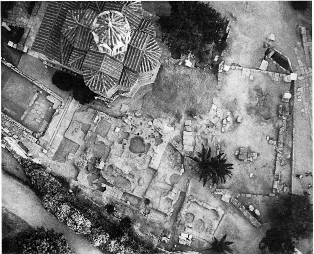
Abb. 2 Die Fundamente der Münzstätte aus der Vogelschau.

Zufall, daß die Metronomoi , die staatlichen Eichbeamten, ihren Sitz in der Nachbarschaft hatten.