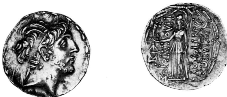
Fig. 4 Antiochus IX Cyzicenus, Tetradramma, Antiochia: collezione dell'autore.