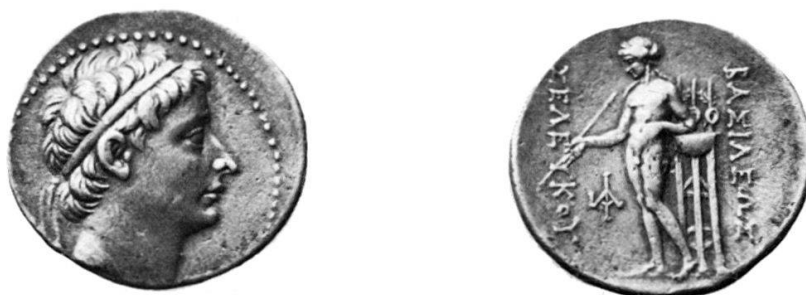
Fig. 2 Seleucus II Callinicus, Tetradramma, Antiochia: ex coll. Niggeler 457.

Una breve osservazione sul segno \odot che si trova nel campo del R/: J. N. Svoronos (Numismatique de la Péonie et de la Macédoine avant les guerres Médiques, Journal International d'Archéologie Numismatique, 1913, p. 193) ha mostrato come il segno \odot , non raro su monete traco-macedoni del IV secolo a. C., e generalmente interpretato come un \Theta e pertanto come l'iniziale di un magistrato, sia invece un simbolo, originario della Peonia, che sta a rappresentare il sole. Il nostro bronzo è stato coniato circa un secolo più tardi, ed è difficile scorgere un legame tra la Macedonia e la Cappadocia, sembrando troppo tenue quello rappresentato dal breve periodo (dal 322 al 301 a. C.) in cui questa fu governata da Satrapi Macedoni; ma è certo che anche in questo bronzo il segno \odot unito alla figura di Apollo suggerisce la probabilità che esso stia anche qui a rappresentare il simbolo del sole piuttosto che la lettera \Theta .