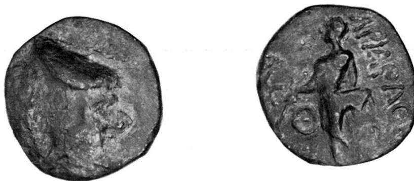
Fig. 1 Ariarathes III, bronzo inedito: collezione dell'autore. Ingr. 2 volte.

seduta, sia in piedi, effigie che rimarrà poi a caratterizzare tutta la monetazione di Cappadocia (con la sola eccezione dell'obolo e di un bronzo di Ariarathes VI) fino a che l'ultimo Re, Archelaus, la sostituirà con la clava di Ercole. Appare verosimile che questo bronzo (con un'effigie che non era mai comparsa prima, e che non comparirà mai più in seguito) abbia preceduto le monete con Athena, e costituisca quindi la prima monetazione di Ariarathes. Anche l'assenza del titolo di Basileus (a meno che le lettere illeggibili sul bordo s. della moneta non siano il residuo di questo titolo 2 , deporrebbe in favore dell'ipotesi che questa sia la prima moneta da lui conosciuta.