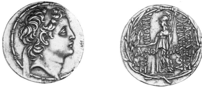
Fig. 3 Ariarathes VII, Tetradramma: Ex Vendita Leu 20 (1978), 154.

Anche qui è necessario rifarsi alla contemporanea monetazione Seleucide. In Siria, alla morte di Demetrius Nicator (125 a. C.), era salito sul trono il maggiore dei suoi figli, Seleucus V; ma la madre di lui, Cleopatra (che era stata successivamente moglie di Alexander Bala, di Demetrius Nicator e di Antiochus VII Sidetes) si affretta ad ucciderlo (o a farlo uccidere) per assumere lei stessa il potere. Ben presto però essa associa al trono il giovane Antiochus VIII Grypus (egli pure figlio di lei e di Demetrius), ma questi, nel 121 a. C., obbliga la madre a bere il veleno che essa stessa aveva preparato per lui, e rimane solo al potere (121–96 a. C.). Nel 114 a. C., però, si ribella contro di lui il fratellastro Antiochus IX Cyzicenus, figlio di Cleopatra e di Antiochus Sidetes (114–95 a. C.), ed il regno rimane diviso fra Antiochus VIII ed Antiochus IX, avendo quest'ultimo assunto il governo della Coele-Siria e della Phoenicia. Sia Antiochus Grypus (eccezionalmente), sia Antiochus Cyzicenus (quasi abitualmente) hanno coniato tetradrammi con l'effigie di Athena Nikephoros a s. e con la scritta ΒΑΣΙΛΕΩΣ ΑΝΤΙΟΧΟΥ ΕΠΙΦΑΝΟΥΣ il primo, e ΒΑΣΙΛΕΩΣ ΑΝΤΙΟΧΟΥ ΦΙΛΟΠΙΑΤΟΡΟΣ il secondo, e con monogrammi e lettere varie; il tutto entro una corona di due rami di lauro.