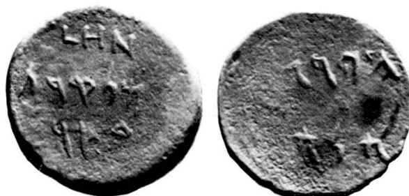
Fig. 2 Tessère de bronze, coll. privée. Photo d'après moulage.

Les caractères sont très proches de ceux qui figurent, au trait, dans l'article précité 2 mais il ne s'agit évidemment pas du même coin sur lequel on aurait ajouté une date. Le bord est bisauté, légèrement, comme dans l'exemplaire décrit par Seyrig, qui en tirait la conclusion que la frappe était antérieure à 126–125 a. C. 3 et suggérait même qu'elle était contemporaine de l'octroi de la consécration et de l'asylie qu'elle mentionne précisément. L'indication d'une année 58 sur la première face ne permet pas de retenir la suggestion en question; nous sommes alors en 84–83 a. C., année de