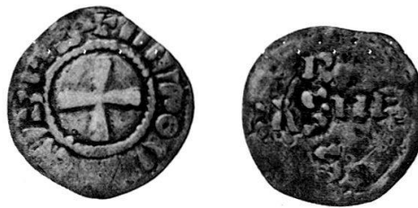
Abb. Remigius Faesch, Thesaurus rei nummariae 1628, S. 262 4

Verbleib: vermutlich identisch mit Expl. im Hist. Museum Basel