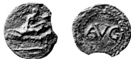
Fig. 6 Punzone E