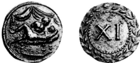
Fig. 3 Punzone B