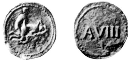
Fig. 2 Punzone A