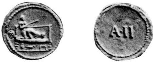
Fig. 1 Punzone A