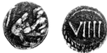
Fig. 4 Punzone B