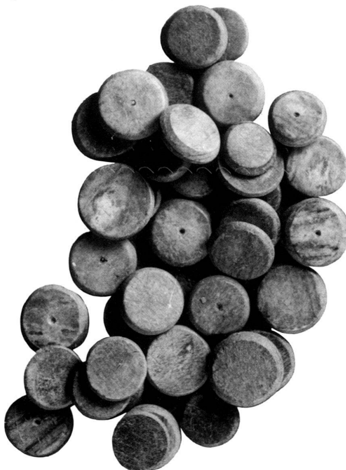
Fig. 1: Assortiment de jeu (jetons et dé).

Il contenait un matériel extrêmement intéressant constitué de 6 monnaies, d'un assortiment de jeu (40 jetons dont 2 portent en graffito le nom de leur propriétaire IUSTUS et 2 dés en os), d'une fibule, d'une petite boîte ronde (peut-être une boîte à cachet), d'une clé, de deux anneaux et d'un instrument métallique (peut-être une balance). 1