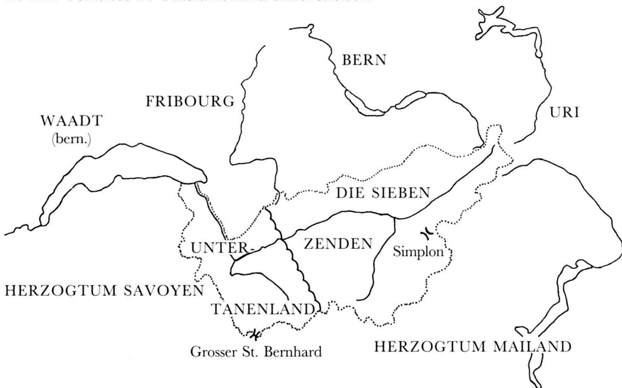
Abb. 1: Das Wallis und seine Nachbargebiete.

In der Zeit der Burgunderkriege und im Zuge der Eroberung der Waadt durch die Berner gelang es den Wallisern, vor allem auf Kosten Savoyens, sich die westlichen Rhonetalgebiete bis zum Genfersee als Untertanenland einzuverleiben.