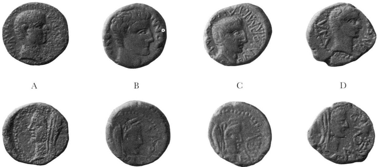
Abbildung 1: Tiberische Münzen aus Panormos: Ganzstücke mit Tiberius und Livia (Fundmünzen vom Monte Iato).

ging, den Kaiser eines Ganzstückes zu bestimmen 18 . Es verwundert daher nicht, dass auf diese Weise die erstaunlichsten Zuschreibungen zustande kamen 19 . Zur Beurteilung der panormitanischen Münzbildnisse – und dies gilt ebenso für andere provinzielle Münzporträts – muss also ein anderer methodischer Ansatz gewählt werden. Dieser geht nicht vom Einzelstück, sondern vom grösseren Zusammenhang einer Prägung aus. Im Falle der Panormitaner Ganzstücke ist der Zusammenhang durch das zugehörige Halbstück mit Germanicus und Drusus und damit durch den Kontext der julisch-claudischen Dynastie gegeben. In diesem Rahmen kann auf der Vorderseite des Ganzstücks nur Tiberius dargestellt sein. Im selben dynastischen Zusammenhang lässt sich auch das Bildnis der Livia auf der Rückseite erklären. Im übrigen ist ihre auch in der Grossplastik belegte Darstellung als Ceres 20 in der Münzprägung der Provinzen äusserst beliebt 21 .