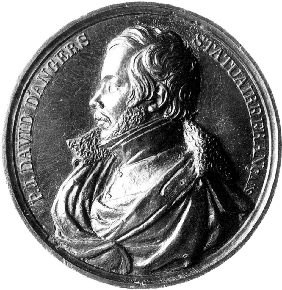
Abb. 8: HFB, David d'Angers, 1834 Guss, Blei, 98 mm