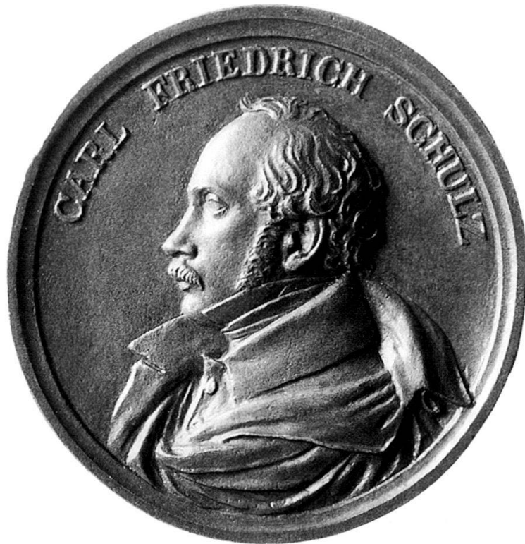
Abb. 17: HFB, Carl Friedrich Schulz, o.J. (um 1835?) Guss, Bronze, 77 mm