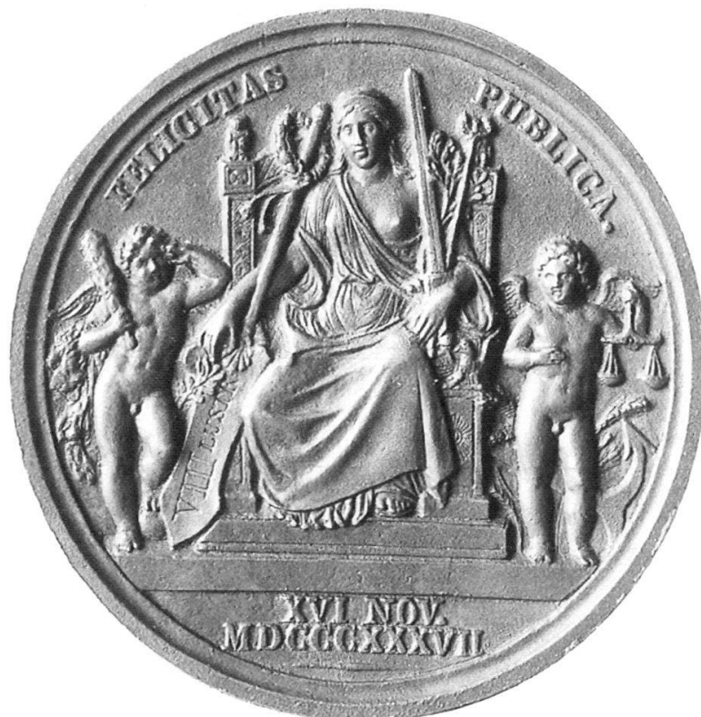
Abb. 12: HFB, König Friedrich Wilhelm III., 1837 Guss, Bronze, 78 mm