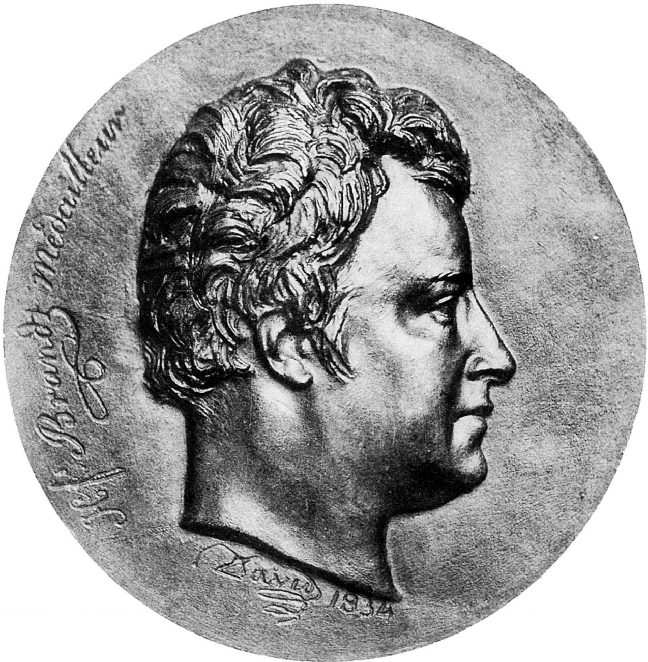
Abb. 7: David d'Angers, Henri François Brandt, 1834 Guss, Bronze, 175 mm

Plastizität eine technische Herausforderung darstellen musste (Abb. 4). Als ein weiteres markantes Beispiel für anspruchsvolle, erhabene Reliefgestaltung sei die Humboldt-medaille von 1828 angeführt, die der Künstler zur Erinnerung an die berühmten Vorlesungen des Gelehrten über «Physikalische Geographie» schuf 9 (Abb. 5). Brandt schnitt das Kopfbildnis mit einem sich 6 Millimeter (!) vom Grund der 63 mm grossen Medaille abhebenden Relief. Abgesehen von der prägetechnischen Kompliziertheit