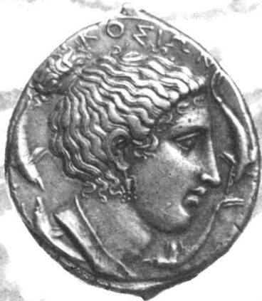
Syracuse, vers 410 avant J.-C.