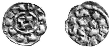
Abb. 1: Lucca, Denar (Typ K. B/C), 0,95 g. Univ.Slg. Tübingen (Efd. Raum Aléppo).

Weil Lucca eine der ursprünglich sechs, später vier königlichen Münzstätten in Italien war, trugen die Luccheser Denare des Hochmittelalters Namen und Titel der italienischen bzw. deutschen Könige und Kaiser. Dies führte dazu, dass seit dem Regierungsantritt Heinrichs III. (bzw. Heinrichs II. als italienischer König) im Jahre 1039 bis über den Tod von Heinrich V. (1125) hinaus, ausserdem zuvor schon unter Heinrich II. bzw. I. (1004–1024 König in Italien), stets der bereits immobilisierte Titel «+IHPERATOR» um ein Henricus-Monogramm im Perlkreis auf den Avers geprägt wurde, und auf dem Revers der Name «+ENRICVS» um den stilisiert angeordneten Stadtnamen «LV CA» zu lesen war. Daher muss erst noch der Versuch unternommen werden, die Masse der Luccheser Heinrichs-Denare oder «denari enriciani», wie sie in Italien heute genannt werden, aufgrund stilistischer Merkmale und der Machart zu differenzieren, zu klassifizieren und annäherungsweise zu datieren.