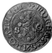
Abb. 2: Billon, 2,15 g, 90° (Zweites bekanntes Stück).