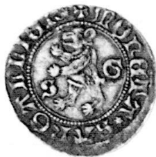
Abb. 1: Das Stück von Edwin Tobler; Billon, 1,95 g, 135°.

Im SM Nr. 173 (Juli 1994), S. 31 (R. Kunzmann, Noch ein Exemplar der rätselhaften Münze aus St. Gallen) wurde irrtümlich die Rs. von Abb. 1 zweimal reproduziert. Die beiden Abbildungen sind hier deshalb nochmals wiedergegeben; für die Verwechslung bitten wir um Entschuldigung.