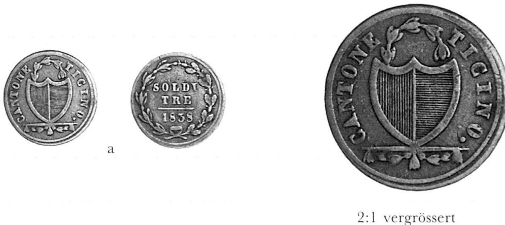
Abb. 4 a–d: Vermutete zeitliche Prägefolge von vier Münzen mit identischen Vs.-Stempeln.

a) 3 Soldi 1838 (Della Casa 29), frühe Prägeperiode.