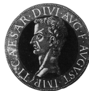
Abb. 4: Das Bild des Tiberius aus Hubert Goltzius «Vivae omnium fere imperatorum imagines».

Die Übernahme von Münzbildnissen ist im 16. Jahrhundert kein Einzelfall. Mit der aufkommenden Antikenrezeption in der italienischen Renaissance ist auch das Interesse an antiken Münzen erwacht. Diese wurden kopiert, darüber hinausgehend aber auch schöpferisch umgesetzt und in neue Zusammenhänge hineinkomponiert (Abb. 6–7) 22 . Nördlich der Alpen griffen die Kleinmeister dieses Thema als Gestaltungsmedium auf 23 und, von diesen ausgehend oder auch auf anderen Grundlagen fussend, wurden Porträts römischer Kaiser oder Kaiserinnen ein beliebtes Dekormittel im Kunsthandwerk. Kaiserabbildungen finden sich in der