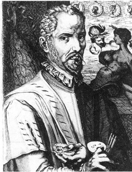
Abb. 3: Porträt des Hubertus Goltzius, Kupferstich von Philips Galle (?), 1579.

wichtigstes Werk ist das 1557 zum erstenmal erschienene «Vivae omnium fere imperatorum imagines» des Hubertus Goltzius (1526–1583) (Abb. 3) zu erwähnen. Weitere Ausgaben wurden 1557 in Deutsch, Italienisch und Französisch,