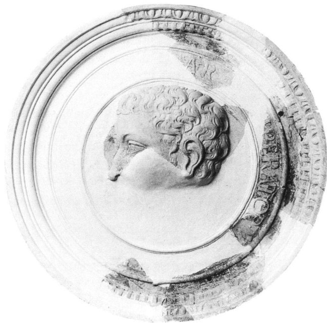
Abb. 1: Der erste Rekonstruktionsvorschlag des Kaisermedaillons, nach dem jetzigen Stand ist das über dem Kopf sitzende Fragment wahrscheinlich vor dem Gesicht anzuordnen.

1990 begannen archäologische Untersuchungen an Schloss Horst, einem der bedeutendsten Renaissanceschlösser Nordwestdeutschlands, von dem heute jedoch nur noch Reste erhalten geblieben sind 1 . Die Anlage wurde vom kurkölnischen Marschall und Statthalter des Vestes Recklinghausen, Rütger von der Horst, nach 1554 an Stelle der durch einen Brand schwer beschädigten väterlichen Burg errichtet 2 . Es entstand ein vierflügeliger Bau von rund 50 m Kantlänge, an den Ecken waren vier Türme vorgeschoben. Die mit reicher Sandsteinzier repräsentativ ausgeführten Flügel im Norden waren zweigeschossig ausgeführt, während die Flügel im Süden eingeschossig blieben. Das Bauwerk war mit seiner architektonischen Konzeption und seiner bauplastischen Ausführung in jener Zeit einzigartig in Westfalen.