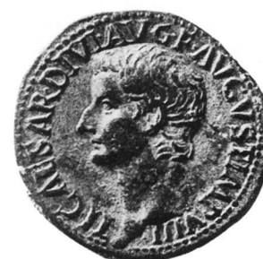
Abb. 5: As des Tiberius.