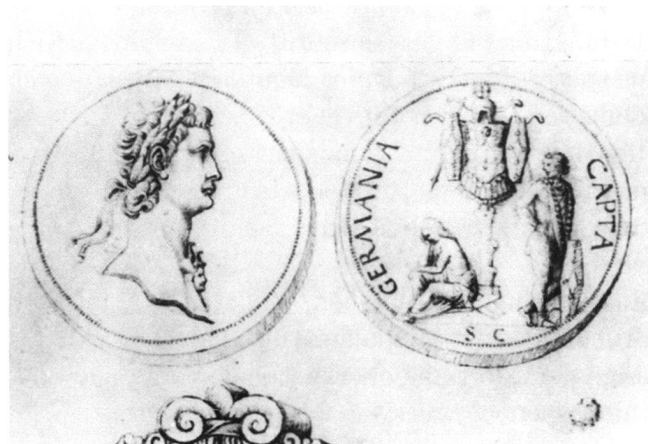
Abb. 6: Kompilation antiker Denkmäler, darunter auch Vorder- und Rückseite einer Münze des Kaisers Domitian. Aus einem Skizzenbuch des Jacopo Bellini (1400–1471).

Auch in der Architektur sind Kaisermedaillons ein beliebtes und weit verbreitetes Gestaltungsmittel. Ohne systematisches Sammeln finden sich Belege von Ungarn 29 , über Südwestdeutschland 30 und das Burgund 31 bis nach Norddeutschland 32 . Diese sind durchaus von unterschiedlicher Wertigkeit und weitgehend unabhängig von der sozialen Stellung des Besitzers, das Spektrum reicht von gut ausgestatteten Bürgerhäusern 33 bis zum Königsschloss des Matthias Corvinus (1443–1490) in Ofen 34 . Sie können einzeln als Dekorelement (Abb.8), dort durchaus aber mit inhaltlicher Aussage, vorkommen 35 , oder sind Bestandteil eines umfangreichen Bildprogramms.