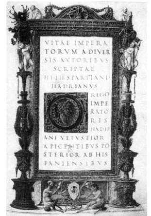
Abb. 7: Münzporträt des Kaisers Hadrian, Scriptores Historiae Augustae (15. Jh.).

häufiger zur Ausgestaltung adeliger Bauten gewählt, so dass auf dem Vergleichswege ihre Symbolik erschlossen werden kann. Als gut aufgearbeitetes Beispiel ist die Schallaburg in Niederösterreich zu nennen. Aus einer ursprünglich romanischen Burgranlage ist durch verschiedene Erweiterungen und einen grossangelegten Umbau in der zweiten Hälfte des 16. Jahrhunderts unter Hans Wilhelm von Losenstein ein repräsentatives Schloss geworden. Von Interesse ist hier der grössere, äussere Burghof, der 1572/73 fertiggestellt wurde. In diesem zweigeschossigen, reich mit Terrakotten ausgestatteten Arkadenhof findet sich an der Fassade eine Folge von Wappen der Schlossherren und ihrer Familie. Quasi hinterlegt sind diese an der Ostwand der Galerie im repräsentativen Gebäudetrakt durch zwanzig Medaillons mit den Porträts römischer Kaiser, die sich von Augustus (31 v.–14 n. Chr.) bis Tacitus (275–276 n. Chr.) erstrecken. Deutlich wird, nicht nur durch die Nähe des Anbringungsortes, der Bezug zur Familienreihe der Schlossbesitzer. Die Kaiser erscheinen als deren Fundament und als ideales Vorbild aller weiterer Herrschaft 36 . Sie gehören damit im weiteren Sinne zu den