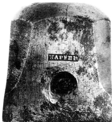
Rückseitenstempel zum Sechzehnerpfennig 1765 (zu Kapossy 3)