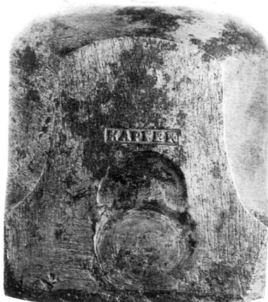
Vorderseitenstempel zum Sechzehnerpfennig 1765 (zu Kapossy 3)