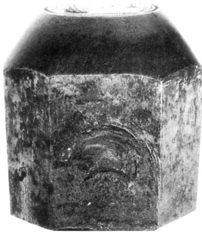
Rückseitenstempel zum Sechzehnerpfennig 1737 (zu Kapossy 2)