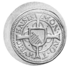
Silberne Erinnerungsmedaille, geprägt mittels Spindelpresse (Auflage 50 Stück).

Nach einem Umtrunk, offeriert vom Numismatischen Verein Zürich, begaben sich noch 20 Teilnehmer zum Abendessen ins Hotel St. Gotthard. Die letzten Unermüdlichen verabschiedeten sich gegen 22 Uhr. Zurück bleibt die Erinnerung an einen sonnigen, ereignisvollen und lehrreichen Anlass, und wir freuen uns bereits auf die nächste Generalversammlung in Lugano am 25. Mai 2002.