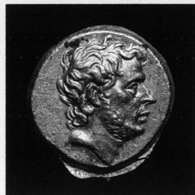
T. Quinctius Flamininus, statère d'or, Grèce, 196 avant JC