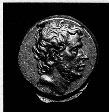
T. Quintus Flamininus, statère d'or, Grèce, 196 avant JC