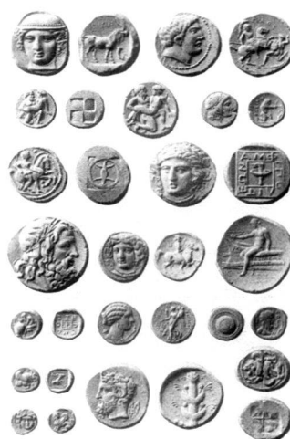
Abb. 4: Ein Probedruck der Firma J. Brunner & Co., Winterthur 1875, mit Gipsen nach Münzen aus der Slg. Imhoof-Blumer.

Wie ist das Ziel des numismatischen Editionsvorhabens der Preußischen Akademie, die Vorlage eines Stempelcorpus, umgesetzt worden? Mommsen hat sich bei der Planung des Corpus Nummorum keine konkrete Vorstellung machen können, was es bedeutet, ein Stempelcorpus zu erarbeiten, welcher gewaltiger Arbeitsaufwand damit verbunden sein würde. Eine Diskussion über die Umsetzbarkeit seines Konzeptes ist weder im umfangreichen Aktenbestand zum Corpus Nummorum noch im Briefwechsel zwischen Mommsen und Imhoof-Blumer 17 nachzuweisen. So begann die Kluft zwischen dem hohen methodischen Anspruch und den begrenzten Möglichkeiten, diesem zu gerecht zu werden, das numismatische Unternehmen der Berliner Akademie zu lähmen. Es fehlte an Mitteln und an geeigneten Bearbeitern, um die Probearbeit Nord-Griechenland innert nützlicher Frist zum Abschluss zu bringen. Als erster Teil des Werkes Die Antiken Münzen Nord-Griechenlands erschien schließlich 1898 der von Berendt Pick (1861–1940) verfasste Band Dacien und Moesien . Er sollte die einzige Publikation des Corpus Nummorum bleiben, die Mommsen gesehen hat; weitere Bände folgten erst in den Jahren 1906, 1910, 1912 und 1935.