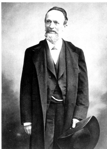
Abb. 1: Friedrich Imhoof-Blumer (1838–1920).

Mommsen und Imhoof-Blumer lernten sich im Frühjahr 1878 in Italien kennen, im Herbst desselben Jahres erschien Imhoof-Blumers bahnbrechende Studie Die Münzen Akarnaniens 9 . Er wies darin nach, dass unterschiedliche Münztypen aus einem gemeinsamen Rückseitenstempel geprägt worden sind und damit ein- und derselben Prägestätte zugewiesen werden müssen. Die Münzen Akarnaniens gelten zu Recht als Meilenstein in der methodischen Entwicklung der numismatischen Forschung 10 und ohne sie ist Mommsens Vision eines umfassenden Stempelcorpus nicht denkbar.