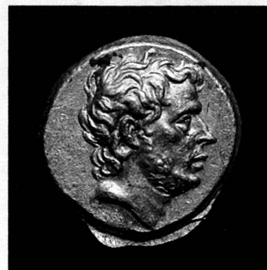
T. Quinctius Flamininus, statère d'or, Grèce, 196 avant JC