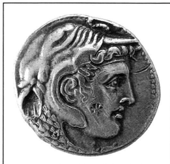
Ptolémée I er pour Alexandre le Grand, Egypte, 323-306 av. J.-C., tétradrachme, argent.

SALLE DE LECTURE mardi à jeudi 09h00-12h00 14h00-17h00 lundi, vendredi et samedi fermé