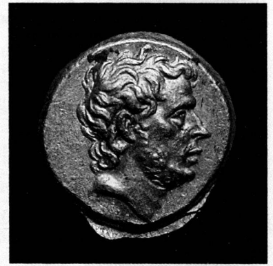
T. Quinctius Flamininus, statera d'or, Grèce, 196 avant JC