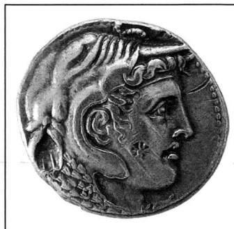
Ptolémée I er pour Alexandre le Grand, Egypte, 323–306 av. J.-C., tétradrachme, argent.

SALLE DE LECTURE mardi à jeudi 09h00–12h00 14h00–17h00 lundi, vendredi et samedi fermé