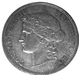
5 Franken 1896 Äusserst selten! Taxe CHF 25'000,-