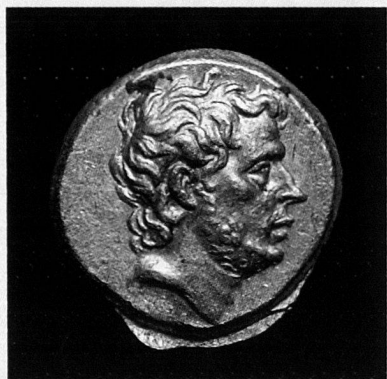
T. Quinctius Flamininus, statère d'or, Grèce, 196 avant JC