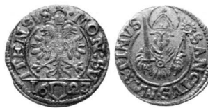
Abb. 7: Schilling von Schwyz 1623.