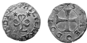
Abb. 2: Kreuzer von Hildebrand I. von Riedmatten, Bischof von Sitten.

Wohl bald nach seiner Einsetzung als Bischof von Sitten, liess Hildebrand I. von Riedmatten (1565–1604) massenhaft Kreuzer prägen (Abb. 2), denn am 16. Oktober 1572 meldete die Stadt Luzern in einem Dokument: «Die Walliser kreuzer halten 3 lott» 11 . Dieses Nominal wurde während vielen Jahren in grossen Mengen geschlagen, und so verwundert es nicht, dass die kleinen oberitalienischen Münzstätten solches Geld gerne als Vorlage benützten. Bis heute kannte man Kreuzernachahmungen von Frinco und von Castiglione delle Stiviere, etwa 25 km westlich von Verona gelegen 12 . Diesen zwei Beis schlägen kann nun ein weiterer, bis heute unbekannter Kreuzer aus Passerano, hinzugefügt werden.