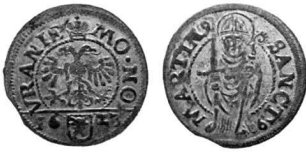
Abb. 6: Schilling von Uri 1623.