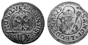
Abb. 5: Schilling von Luzern 1623.