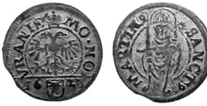
Abb. 6: Schilling von Uri 1623.