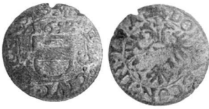
Abb. 4: Groschenbeischlag mit der Jahreszahl 1612.

Nun hat dieser eine entsprechende Geschwistermünze, welche allerdings die Jahreszahl 1612 aufweist (Abb. 4) 19 .