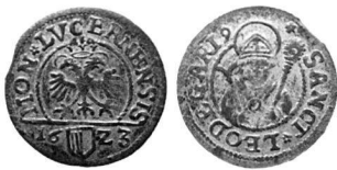
Abb. 5: Schilling von Luzern 1623.