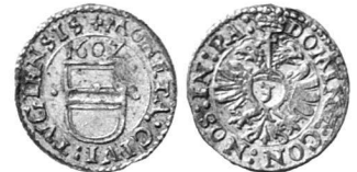
Abb. 3: Zuger Groschen von 1602.

Die Münze imitiert Groschen der Stadt Zug der Jahre 1600 bis 1608, ein Nominal, welches in mehreren hundert Varianten vorkommt und wohl eine der wichtigsten Exportmünzen seiner Zeit darstellte (Abb. 3) 17 . Sowohl zeitgenössische Fälschungen als auch Beischläge sind Zeugen der weiten Verbreitung dieses Geldes 18 . Die Groschen mit dem Wappen zwischen zwei Punkten sind die häufigsten Zeichnungsvarianten, und so verwundert es nicht, dass die Nachahmer gerade diesen Typ als Vorlage für ihre Imitationen auswählten. Dies gilt auch für den neu entdeckten Beischlag mit der Jahreszahl 1613.