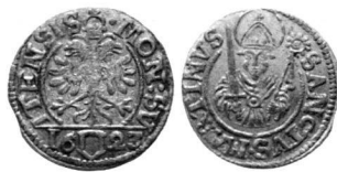
Abb. 7: Schilling von Schwyz 1623.