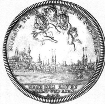
STADT NÜRNBERG Doppelter Reichstaler o. J. (1711), mit Titel Karls VI. Kabinettstück. Vorzügl.-Stempelglanz.