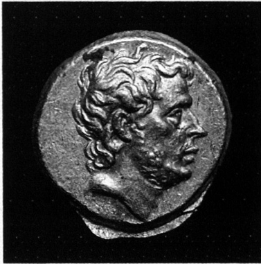
T. Quintius Flamininus, statère d'or, Grèce, 196 avant JC