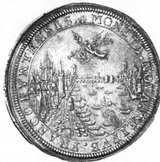
STADT FRANKFURT Reichstaler 1695, mit Titel Leopolds I. Prachtexemplar. Vorzüglich-Stempelglanz.