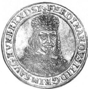
HERZOGTUM SCHLESISIEN Ferdinand III., 1625-1637-1657. ½ Reichstaler 1650 GH, Breslau. Vorzügliches Exemplar.