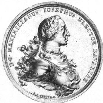
KÖNIGREICH POLEN. August III., 1733-1763. Goldmedaille zu 50 Dukaten o. J. (1759), auf seine 3. Tochter, Maria Anna von Polen und Sachsen und ihren Gemahl, Maximilian III. Josef, Kurfürst von Bayern. Vorzüglich.