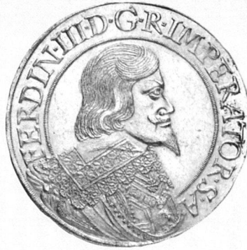
RÖMISCH-DEUTSCHES REICH Ferdinand III., 1625-1637-1657. 10 Dukaten 1638, Prag. Vorzügliches Prachtexemplar.