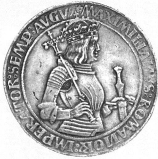
RÖMISCH-DEUTSCHES REICH Maximilian I., 1490-1519. Guldiner o. J., Hall. Kaiserguldiner. Vorzüglich.