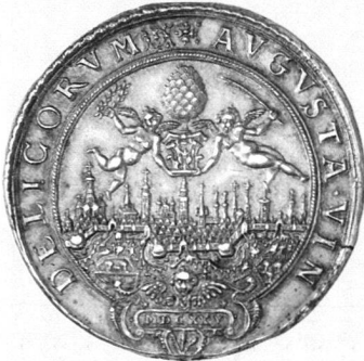
STADT AUGSBURG Doppelter Reichstaler 1625, mit Titel Ferdinands II. Vorzügliches Exemplar.