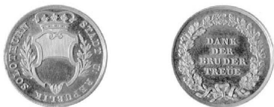
Abb. 4: Goldene Verdienstmedaille o.J. (Stempel von Chr. Fueter), zu Wunderly 1961, 29 mm, 10,4 g.

Dem Ratsmanual vom 20. Juni 1814 ist weiter zu entnehmen, dass die Offiziere aus Bern für die guten Dienste mit einer goldenen kleineren Medaille belohnt werden sollten: «Den Herren Officiers von Bern solle eine goldene kleinere Medaille zugestellt werden, die auf der einen Seite das Wappen der Republik, auf der anderen die Worte Dank der Brüdertreue enthalten solle. Diese nehmliche [=gleiche] Medaille wird in Silber den Unterofficieren u(nd) Soldaten behändigt». Die Ausführung wurde dem Berner Stempelschneider Christian Fueter 16 übertragen, der die Umsetzung gestützt auf die detaillierten Angaben sicherstellte (Abb. 4). Es schien, als existierten für die Ausführung in Gold und Silber zwei