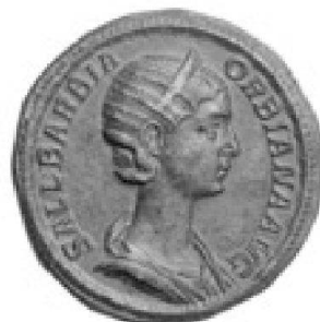
Salustiana Barbara Orliana, secessore de bronzo

TRADART GENEVE SA 1, rue du Perron - 1204 Genève Tel +41 22 817 37 47 - Fax +41 22 817 37 48 e-mail : numismatique@tradart.ch site : www.tradart.ch