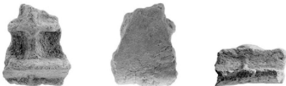
Fig. 8: Fragment de moule à alvéoles en terre cuite découvert dans une fosse à Avenches VD (Aventicum), Sur Fourches (fouilles 2004), avers, revers et bord.

mis au jour un fragment de moule à alvéoles (fig. 8) probablement destiné à la production de flans monétaires, un flan non frappé mais martelé (fig. 9) et des quinaires (des Eduens ainsi que des types «Büschel» et Ninno) 22 . Ils étaient associés à diverses catégories de mobilier (céramique, petit mobilier métallique, faune, etc.) datés de l'époque LT D2a, soit des années 80–50/40 av. J.-C.