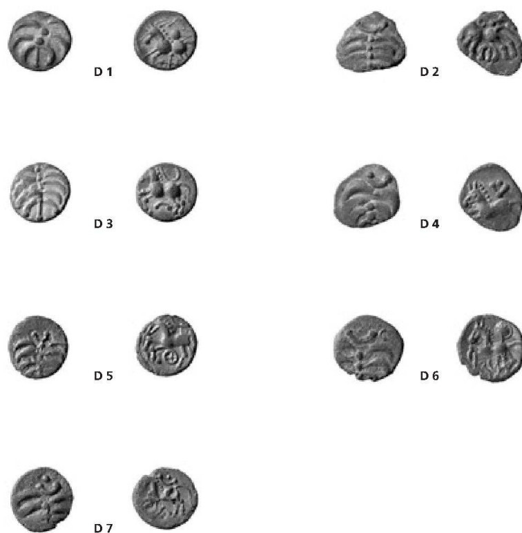
Fig. 5: Nouvelle typologie fine du groupe D des quinaires de type Büschel. Les monnaies proviennent d'Altenburg (D) (1994–2004).

Le problème principal du quinaire de type «Büschel» réside dans le fait qu'il est généralement frappé sur des flans très étroits et que, de ce fait, l'image est souvent tronquée. Si bien qu'il est nécessaire de disposer de grandes séries de pièces pour espérer reconstituer le motif complet d'un type monétaire ou alors d'en établir une variante. Aujourd'hui, la restitution de certains types monétaires est devenue possible grâce, en particulier, à deux sites de l'époque de La Tène finale, Altenburg (D) et Rheinau ZH qui ont livré quantité de nouvelles trouvailles. La contribution d'autres établissements tels que Vindonissa ou Aventicum n'est pas négligeable non plus 18 . Les variantes des groupes suisses D, F et H selon Derek Allen 19 , ont pu ainsi être précisées (fig. 5).