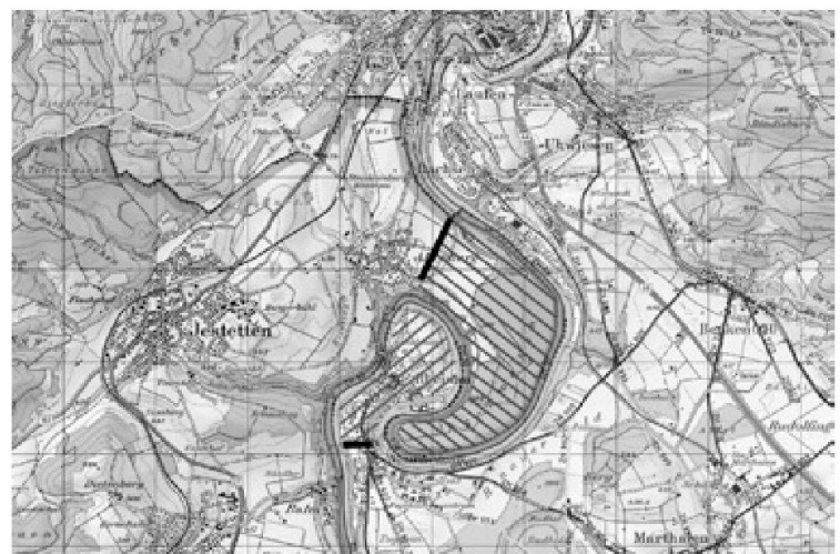
Fig. 11: Emplacement des établissements d'Altenburg, Schwaben (D) et de Rheinau, Au ZH dans une boucle du Rhin. En hachuré la zone d'occupation des habitats de La Tène tardive.