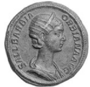
Sallustia Barbia Orbiana, sestertius de bronze

TRADART GENEVE SA 1, rue du Perron - 1204 Genève Tel +41 22 817 37 47 - Fax +41 22 817 37 48 e-mail : numismatique@tradart.ch site : www.tradart.ch