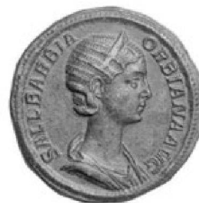
Sallustia Barbia Orbiana, sestertee de bronze

TRADART GENEVE SA 1, rue du Perron - 1204 Genève Tel +41 22 817 37 47 - Fax +41 22 817 37 48 e-mail : numismatique@tradart.ch site : www.tradart.ch