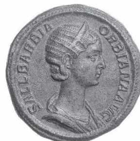
Sallustia Barbia Orbiana, sestertie de bronze

TRADART GENEVE SA 1, rue du Perron - 1204 Genève Tel +41 22 817 37 47 - Fax +41 22 817 37 48 e-mail : numismatique@tradart.ch site : www.tradart.ch